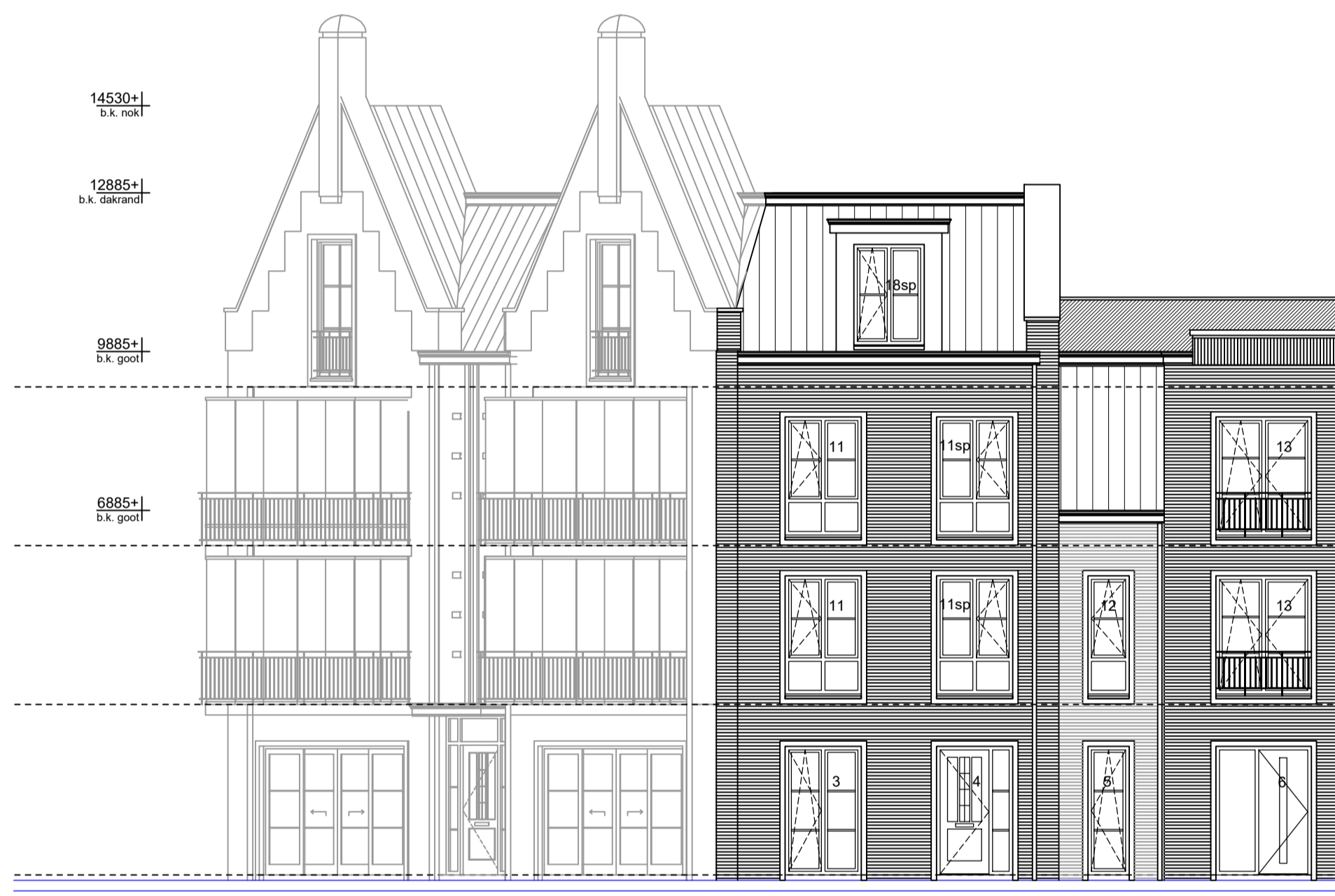
Rechtergevel as A Schaal 1:100