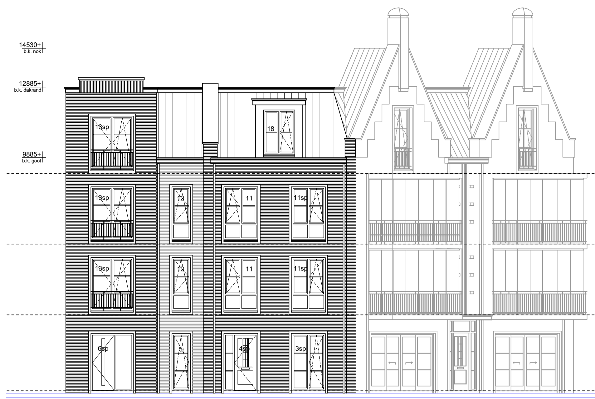
Voorgevel as A Schaal 1:100