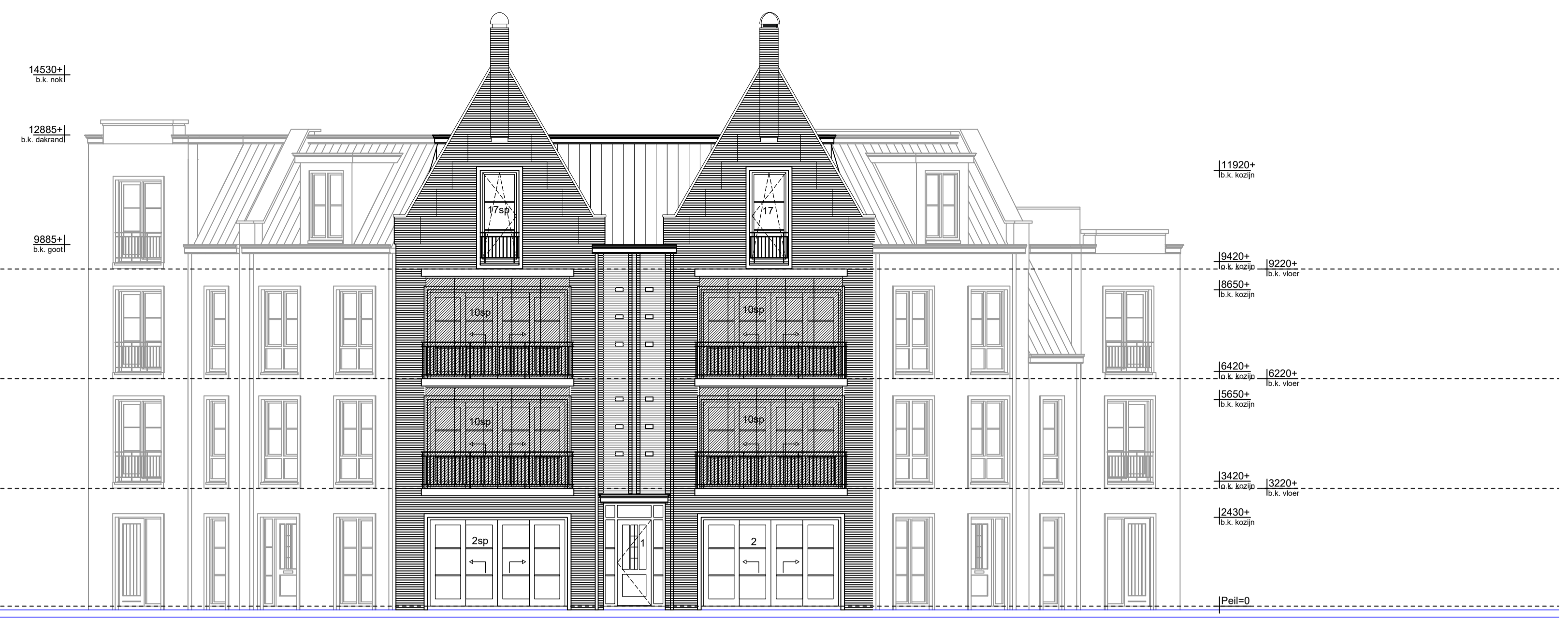
Voorgevel as C Schaal 1:100