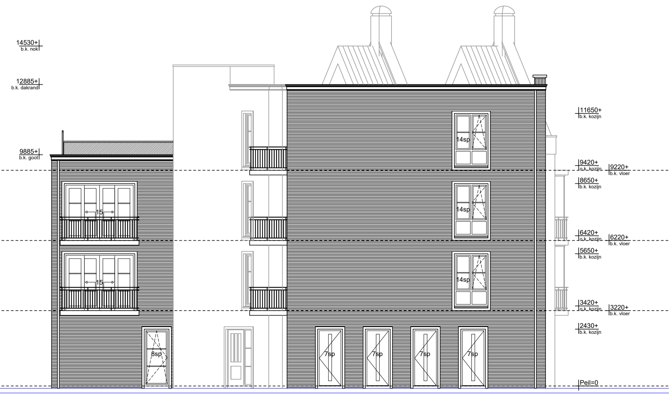
Linkergevel as 1 + B Schaal 1:100